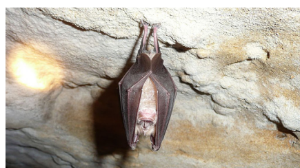
Grand rhinolophe