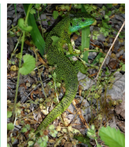
Lézard vert occidental