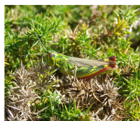
Criquet des ajoncs