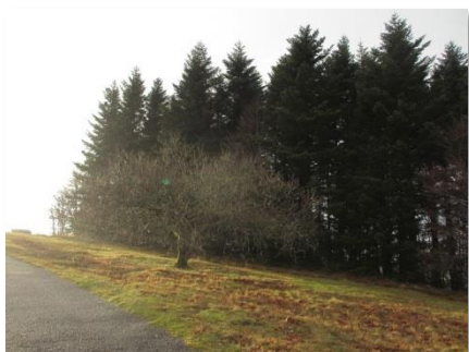
Avant les travaux

Depuis 2011, le Parc naturel régional de Millevaches en Limousin coordonne un projet d'aménagement global du Massif des Monédières. Un travail sur la réouverture des paysages a été engagé notamment avec la Section de Freysselines, la Commune de Chaumeil et l'Office national des forêts. Dans ce cadre, des travaux ont eu lieu dans le courant de l'hiver 2013-2014. Ils ont permis, entre autre, de dégager une vue à l'Ouest et au Nord-Ouest au sommet du Suc au May.