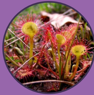
La Drosera à feuilles rondes Plante carnivore vivant dans les tourbières.