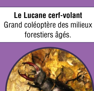
Le Lucane cerf-volant Grand coléoptère des milieux forestiers âgés.